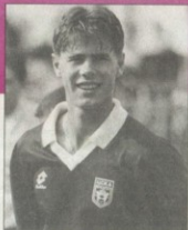
M. Делянов събра най-много гласове

5. Хора, които не са привърженици на ЦСКА, се интересуват изобщо от проблемите на българския футбол.