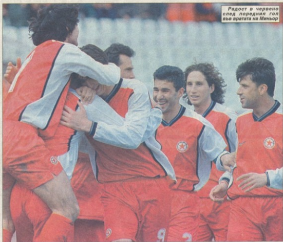
Радост в червено след поредния гол във вратата на Миньор

За разлика от мачовете с Нефтохимик и Велбъжд, сега футболистите с червени фланелки се отблагодариха по най-добрия начин на своите верни почитатели.