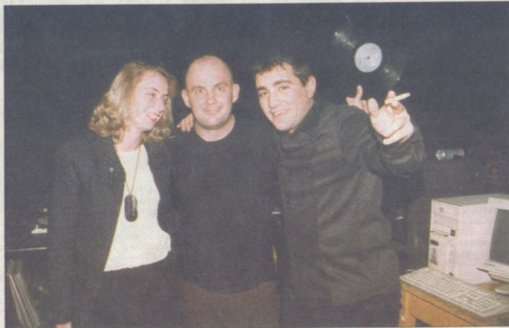
Снимка за спомен с Уест Бъм. Английските техномузиканци са по-приказливи на тема футбол от немските