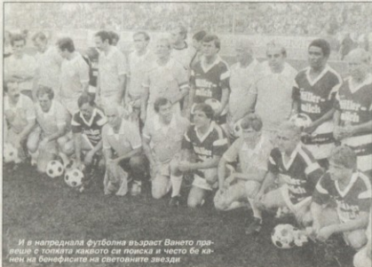
И в напреднала футболна възраст Ването правеше с топката каквото си поиска и често бе каменен на бенефициата на световните звезди

за "червените"). Футболист №1 на България през 1962 г. Има 75 мача в "А" отбора с 25 гола