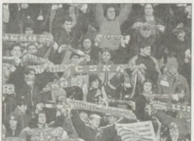
Фенклубът от "Западен парк" осигурява 2800 червени и 700 бели картонки, с които публиката от сектор "Г" ще изпише името на любимия отбор преди първия мач с Левски за купата

Фенклубът се събира всеки вторник и четвъртък от 19.30 часа в кв. "Западен парк". За повече информация и записвания: