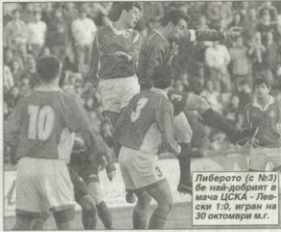
Либерото (с №3) бе най-добрият в мача ЦСКА - Левски 1:0, игран на 30 октомври м.г.

- Да, в интерес на истината имаше такъв период. Постоянно ме преследваха контузии и когато се възстановявах, твърдаше да