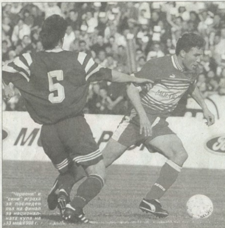
"Червени" и "бели" играха за последен път на финал за националната купа на 13 март 1988 г.

В срда вечните съперници ЦСКА и Левски ще изиграят 28-ия си турнирен мач за националната купа. Досега "червените" имат 9 победи и 13 загуби при 5 ремита, головата разлика е 39:49. Двата тима са изиграли още 3 срещи за купата на Съветската армия, когато тя вече не е била национална купа - на 2 март 1983 г. 4:3 за ЦСКА след дузпи, 1:1 в ред. вр. и прод. (на 1/4-финал), на 14 март 1984 г. 0:1 (полуфинал) и на 13 февруари 1988 г. 0:3 (осминафинал). Вечните врагове за втори път ще играят в два мача с разменено гостуване. За първи път си размениха визити на клубните си стадиони през април 1996 г., но на полуфиналната фаза от турнира.