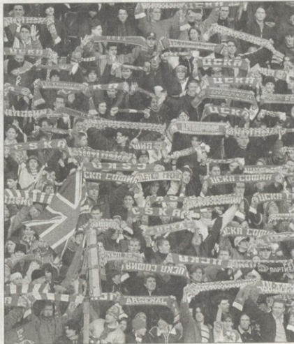
Стената от шалове украси за първи път сектор "Г" в средата на 70-те години

Кога лумнаха първите флаки на победата и за големите битки със "синята" агитка - в следващия брой на "Сектор Г"