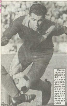
Ванката разполагаше с 4-5 коронни номера, благодарено на които всички крайни защитници му гледаха гърба

що да бъде ликвидиран. Всички ние, които сме дали живота си за ЦСКА, няма да затворим спокойни очи, преди да видим наследниците си да играят като нас. Не бихме се разсърдили и ако ни надминат.